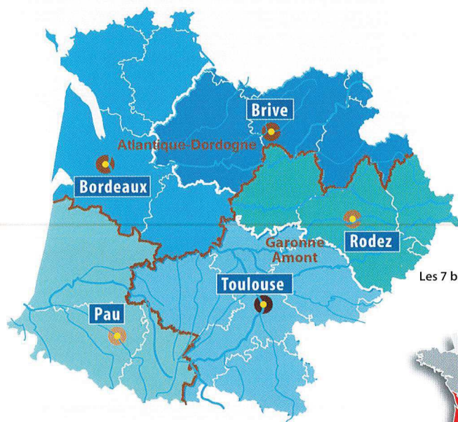
Les 7 bassins hydrographiques métropolitains

Tél. : 05 61 36 37 38 | Fax : 05 61 36 37 28