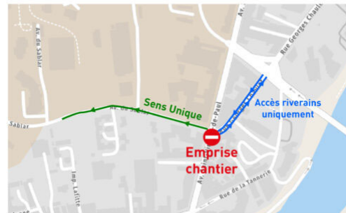
Travaux Avenue St Vincent-de-Paul - Du 10/01 au 14/01

L'avenue St Vincent-de-Paul sera fermée à la circulation au niveau du carrefour Sablar / Georges Chaulet.