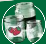
POTS ET BOCAUX EN VERRE