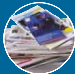
JOURNAUX, CATALOGUES, PROSPECTUS