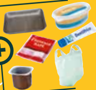
TOUTS LES AUTRES EMBALLAGES EN PLASTIQUE