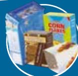
PETITS EMBALLAGES EN CARTON