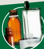
FLACONS EN VERRE