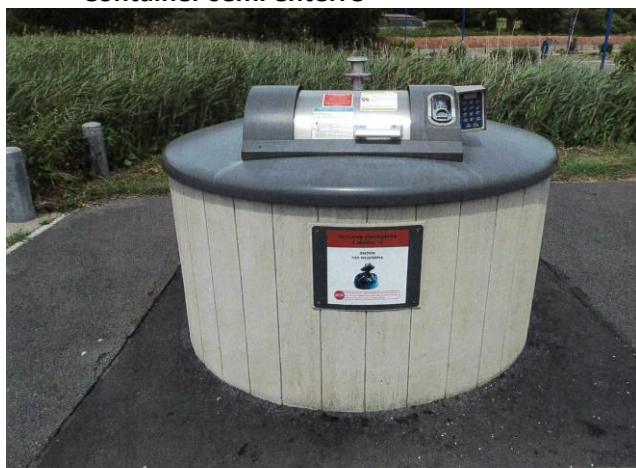
Container semi enterré